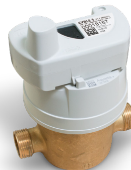
Aquadis+ équipé du module Cyble 5

Pour en savoir plus, visitez itron.com Ensemble, nous pouvons créer un monde plein de ressources.